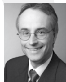
Produkt- & Prozessinnovator Jahrgang 1964 seit 2006 im MA Kern-Pool