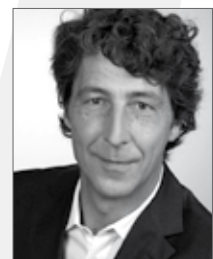
Technischer Produkt-/ Projektmanager Jahrgang 1966 seit 2007 im MA Kern-Pool