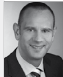
Business Development Manager Jahrgang 1968 seit 2004 im MA Kern-Pool

Nach 3 Monaten können die Abverkäufe über die Homepage signifikant gesteigert werden. Die detaillierte Marketingplanung dient als Grundlage zur Umsetzung erster Kampagnen.